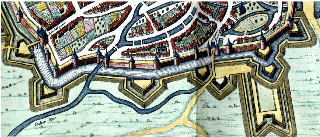
Afbeelding 3 Volledige versie Uitsnede van Maastricht op de stadsplattegrond van Joannes Blaeu uit: Toonneel der steden van de Vereenighde Nederlanden, met hare beschrijvingen , (Amsterdam 1652), Library of Congress, Library of Congress, Geography and Map Division, (G1851 .B52 1652). Washington D.C.

Dat de stedelijke elite aan stadsmuren grote symbolische waarde toekende, blijkt verder uit het feit dat ze op stadsplattegronden in de zeventiende eeuw prominent hun stadsmuren lieten afbeelden. Zie bijvoorbeeld de onderstaande uitsnede van Maastricht met daarop de stadsmuur uit de stedenatlas van Blaeu. Dat gebeurde ook in gevallen waar de muur niet langer in staat was de volwaardige bescherming van de stad te garanderen. Dit gebruik van muren op plattegronden laat zien hoe de symbolen van militaire macht en stedelijk vrijheid met elkaar verband hielden.