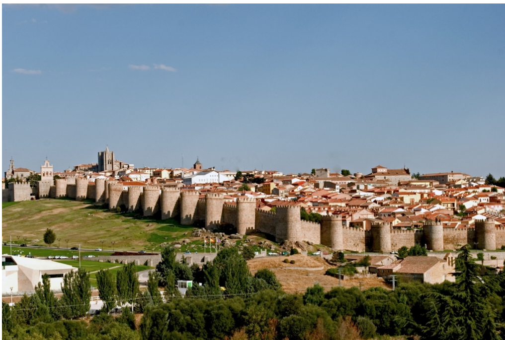
Afbeelding 1 De Middeleeuwse stadsmuur van Ávila in Spanje werd aan het einde van de elfde eeuw gebouwd om de bevolking te beschermen tegen Moorse aanvallen. De muur is slechts 2,4 kilometer lang maar heeft wel tachtig torens en negen poorten. Dat komt neer op een toren na elke dertig meter en een poort om de ongeveer 270 meter. 9 Bron .

Bij vrijwillige stadsstichtingen is dat te begrijpen omdat men concepten zoals vrijheid en gelijkheid op zeer veel verschillende manieren kan invullen en ze alleen binnen een specifiek sociaal-cultureel geldende code of conduct betekenis en legitimiteit krijgen. Begrenzing is daarvoor een noodzakelijke voorwaarde. Begrenzing door middel van muren blijkt daarbij een grote aantrekkingskracht uit te oefenen in situaties waarin de sociaal-culturele gemeenschap samenvalt met een geografisch gebied.