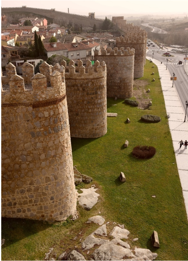
Afbeelding 4 Detail van de Middeleeuwse stadsmuur van Ávila.

Deze tendens heeft vele oorzaken. Ik noem slechts: een ervaren nabijheid door meer media-aandacht voor de buitenstaanders, de collectieve trauma's van vluchtelingen en genocide in de twintigste eeuw, een algemene toename van het veiligheidsniveau en tenslotte: een algehele liberalisering waarbij mensen hun individuele vrijheid als hoogste goed vieren en dat bijvoorbeeld via de mogelijkheid van reizen massaal uitdrukken.